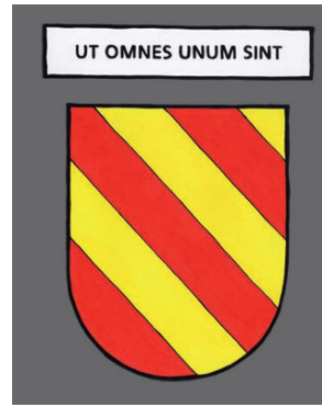
Le Plantay - Que tous soient un