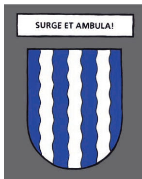
Meymac - Lève-toi et marche !