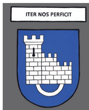
Fribourg - C'est le chemin qui nous fait