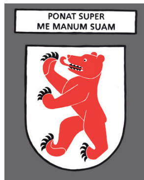
Cham - Qu'il pose sa main sur toi