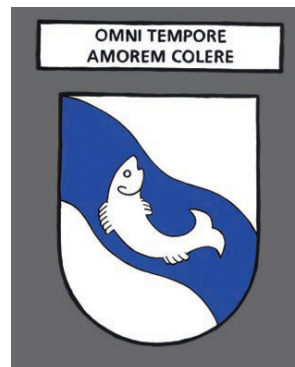
Rickenbach - En tout temps, ressentir la proximité aimante