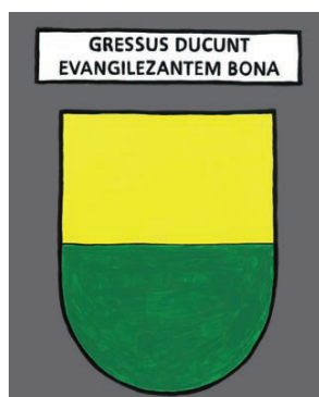
Rolle - Les pas conduisent celui qui porte la Bonne Nouvelle