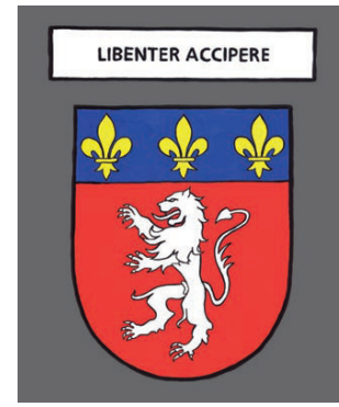
Lyon - Accueillir en liberté