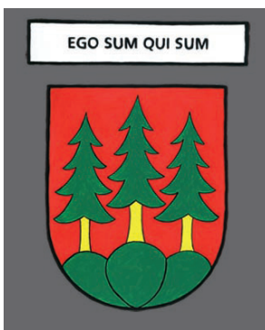
Langnau - Je suis celui qui est