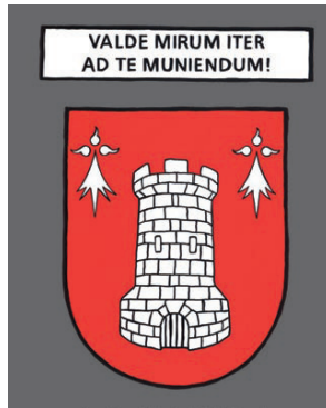
Eveux - Quel drôle de chemin il me fallut prendre pour aller jusqu'à toi