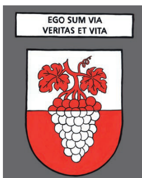
Cully - Je suis le chemin, la vérité et la vie