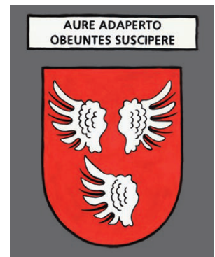
Schüpfheim - Avec une oreille ouverte, être ouvert aux rencontres