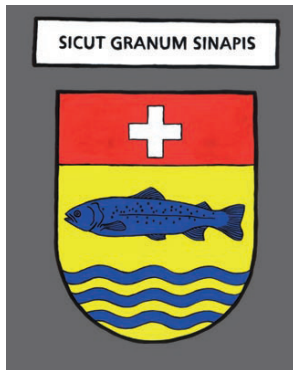
Nantua - Comme une graine de moutarde