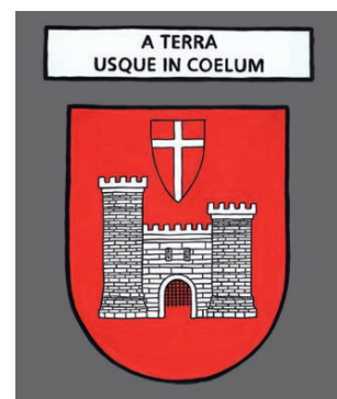
Romont - De la terre jusqu'au ciel