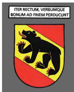
Bern - Le droit chemin et la bonne parole conduisent au but