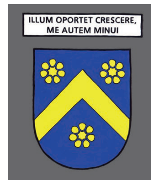
Marcenat - Il faut qu'il grandisse et que moi, je diminue