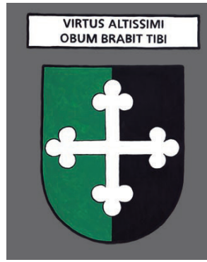
Bourg en Bresse - La puissance du Très Haut te couvrira de son ombre