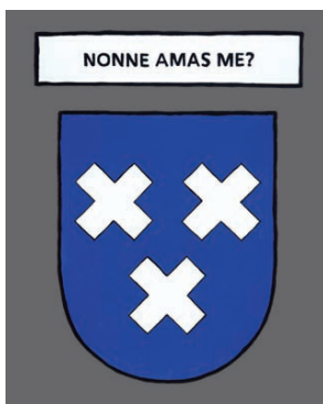
Bort les Orgues - M'aimes-tu ?