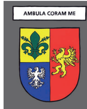
Saint Bonnet Le Château - Marche en ma présence