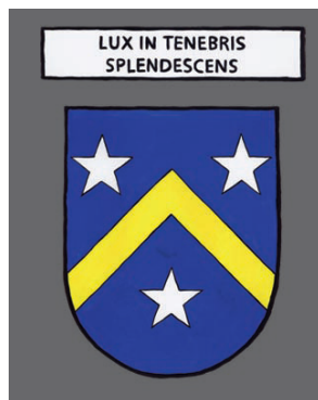
Lavaudieu - Une lumière dans l'obscurité de la nuit