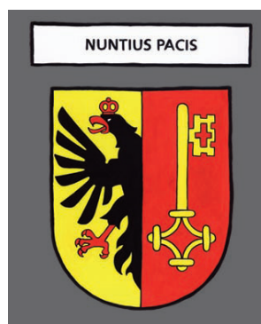
Genève - Messenger de paix