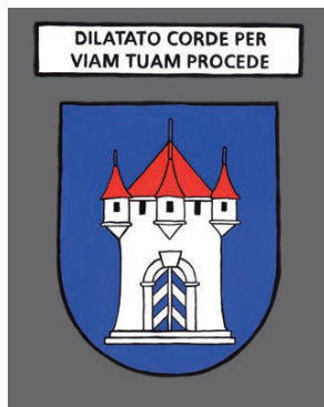
Zürich - Avance sur ton chemin le coeur ouvert