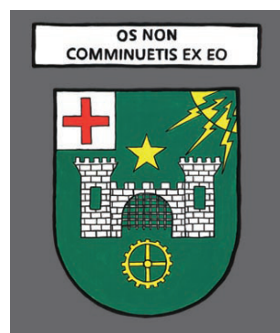
Bellegarde sur Valserine - Pas un os ne te sera brisé