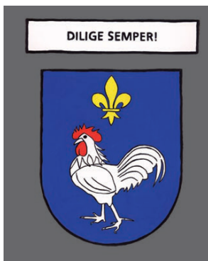
Langeac - Aime toujours !