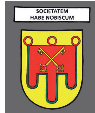
La Chaise Dieu - Sois en communion avec nous