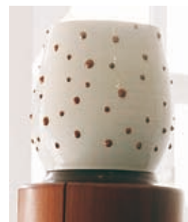
Bécheau - Bourgeois Jeu n°2, détail

* Sculpture , 2004, porcelaine, verre et métal.