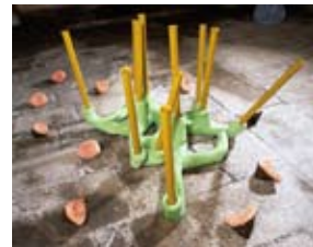
Metzger Le terrier

* Les Mordantes , 1997, mousse synthétique, papier mâché, brou de noix, épingles vernies, 11 x 19 x 21cm