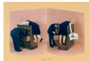
Webb Prehensile torpor

* Prehensile Torpor , 1977, photographies couleurs collées sur carton et texte manuscrit, 34,86 x 49,88 cm