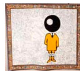
Favier Le bic émissaire

Tapisserie de basse lisse, chaîne de coton, trame en laine, 160 x 140 cm