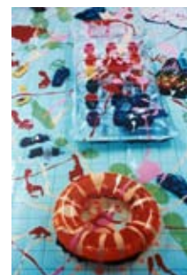
Burrows Fluid Motion

* Fluid Motion (blue), 2001, photographie couleur, 183 x 122 cm